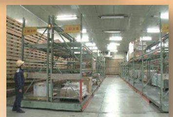
A栋 +5°C冷藏库的外观和内